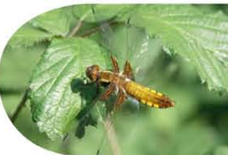
La libellule déprimée