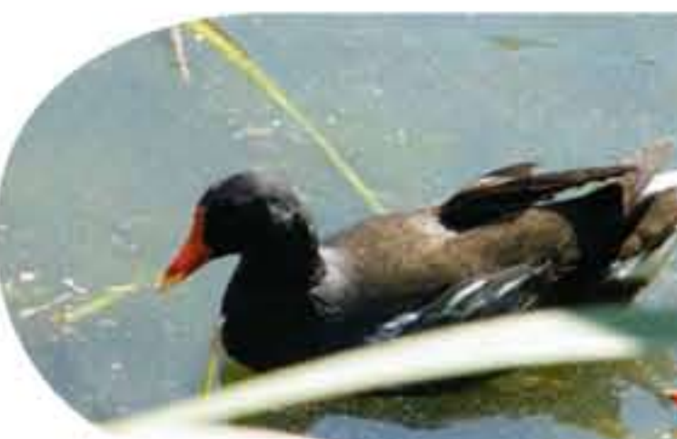
La poule d'eau