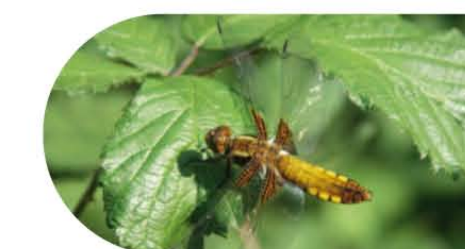
La libellule déprimée