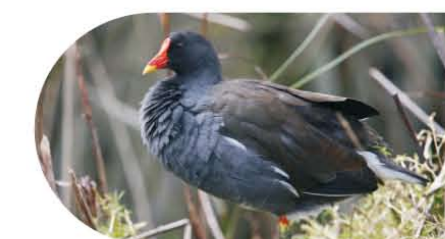
La poule d'eau