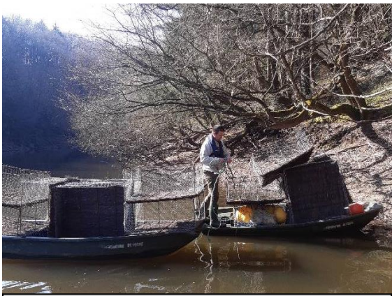
Transport et mise en place - mars 2021

L'anse des Guilliers, au niveau de Lorgeril, est délimitée par des bouées et classée également en réserve de pêche par arrêté préfectoral jusqu'au 13 juin.