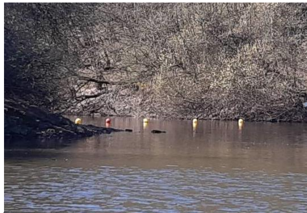
Zone de réserve à Lorgeril - mars 2021