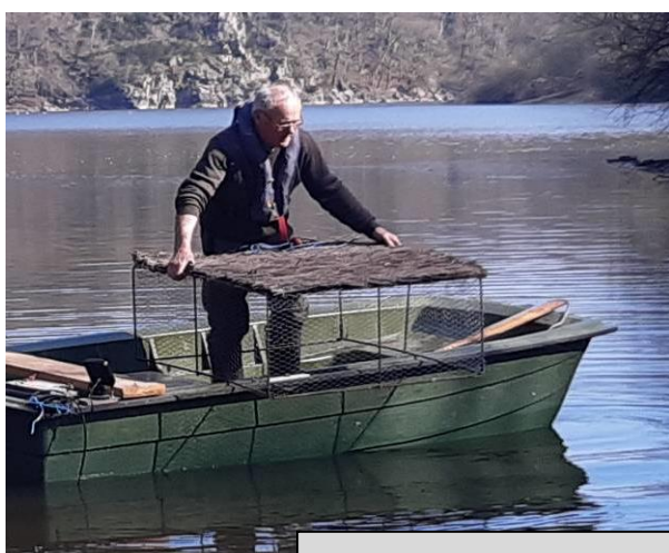
Mise en place - mars 2021