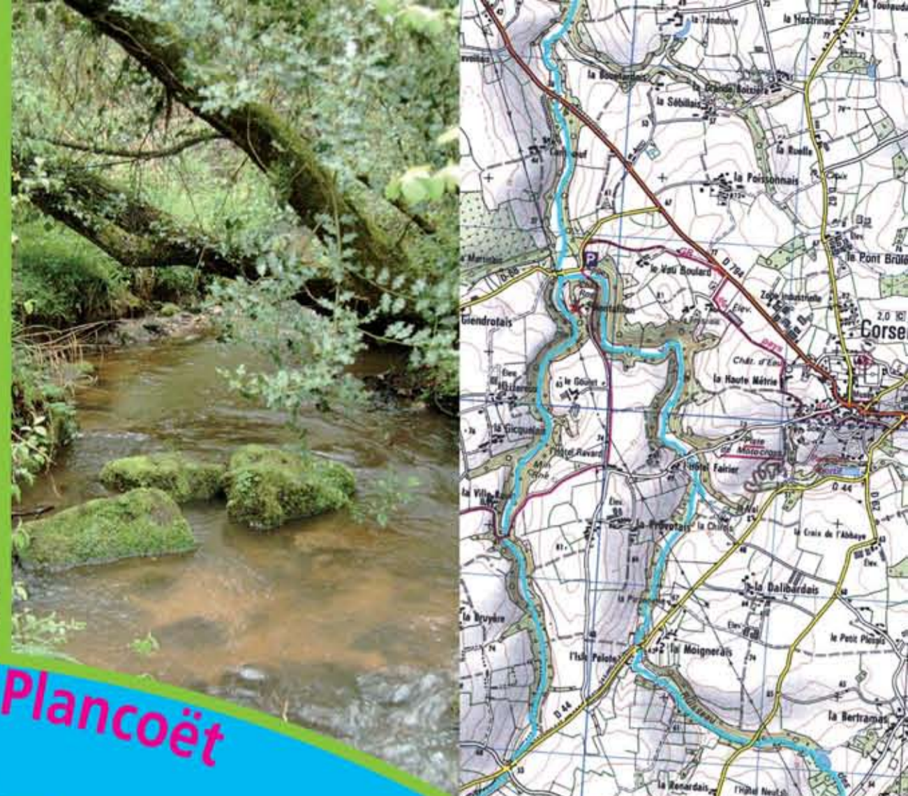
Le Montafilant, rivière de 1 ère catégorie

L'AAPPMA de Plancoët gère un réseau de rivières de première catégorie où la truite fario est le poisson par excellence. La Gesres, le Guébriand et le Montafilant constituent les rivières principales du domaine de l'AAPPMA. Ces petites rivières de plaine, circulent lentement dans les prairies et les sous bois. Les pêches au Toc, à la cuiller ou au vairon sont à privilégier et donnent les meilleurs résultats. Il n'est pas rare de débusquer des poissons de plus de trente centimètre. Les affluents sont aussi à prospecter. Afin de préserver la ressource, la taille limite de capture de la truite est fixée à 23 cm et six poissons par jour.