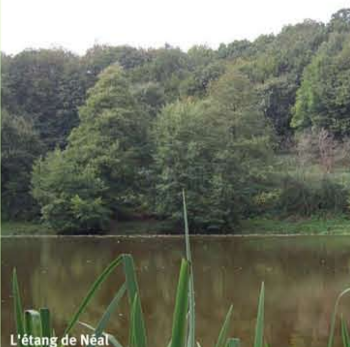
L'étang de Néal

Situé sur l'amont du barrage de Rophemel, entre Guitté et Plouasne, l'étang de Néal est séparé de la grande retenue par une digue. Les abords ont été récemment entretenus par l'AAPPMA locale qui a toutefois su préserver l'aspect sauvage du site. Les bois immergés et les nombreuses touffes de nénuphars dissimulent une belle population de gardons, tanches, carpes et brochets.