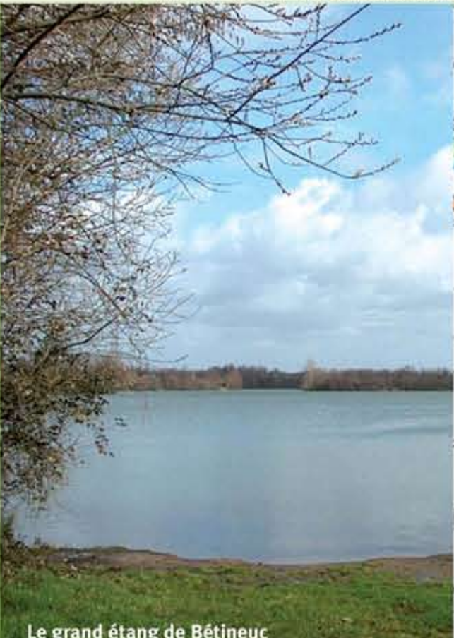
Le grand étang de Bétineuc

Les étangs de Bétineuc à Saint-André-des-Eaux Plusieurs plans d'eau cogérés par les AAPPMA de Plouasne et de Dinan-Evran vous accueillent pour la pêche. Très facile d'accès ce site de 20 hectares est parfaitement conçu pour la pêche en famille ou de découverte. Le petit plan d'eau de la Grenouillère situé à proximité de la base nautique, a été spécialement conçu pour répondre aux attentes des pêcheurs débutants. Accès facile, signalisation, population piscicole abondante permettront à tous de s'amuser. Le grand plan d'eau de 20 hectares est, quant à lui, le site idéal pour pêcher les poissons blancs, la carpe et les carnassiers. Un chemin piétonnier permet de faire facilement le tour du plan d'eau. Pour les amateurs de rivière, la Rance, en seconde catégorie sur ce secteur, vient compléter l'offre de pêche et vous invite à taquiner la perche, l'anguille, le brochet ou le gardon. Attention aux lâchers d'eau du barrage de Rophemel !