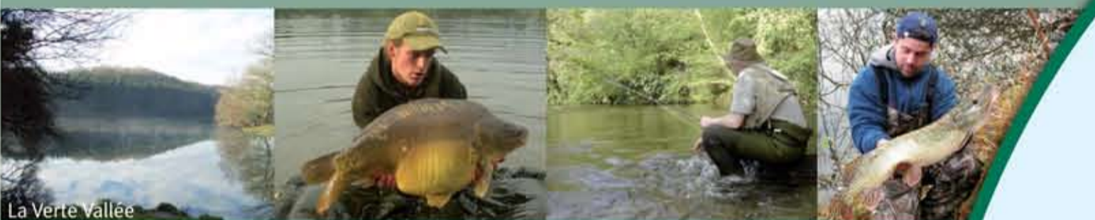
La Verte Vallée