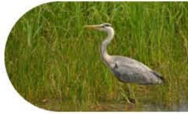
Le Héron cendré