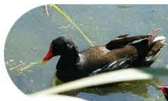
La Poule d'eau