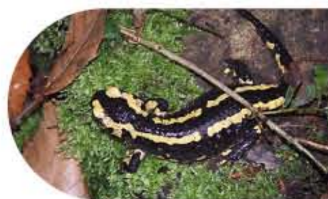
La Salamandre Tachetée