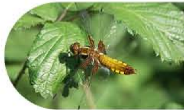
La Libellule déprimée