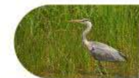
Le Héron Cendré