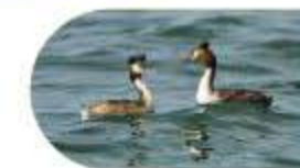
Le Grèbe huppé