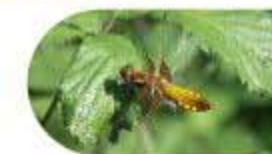
Le Libellule déprimée