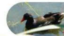
Le Poule d'eau