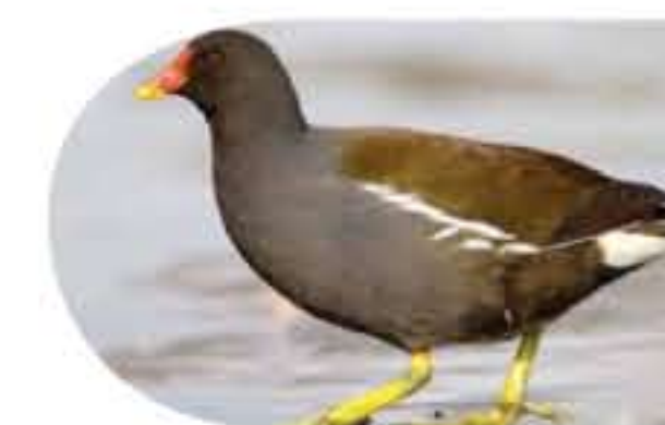
La Poule d'eau