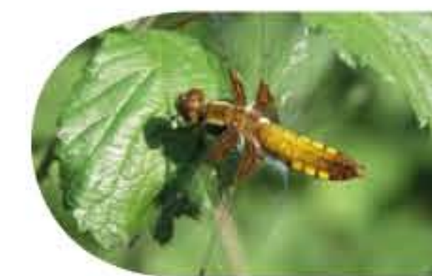
La Libellule déprimée